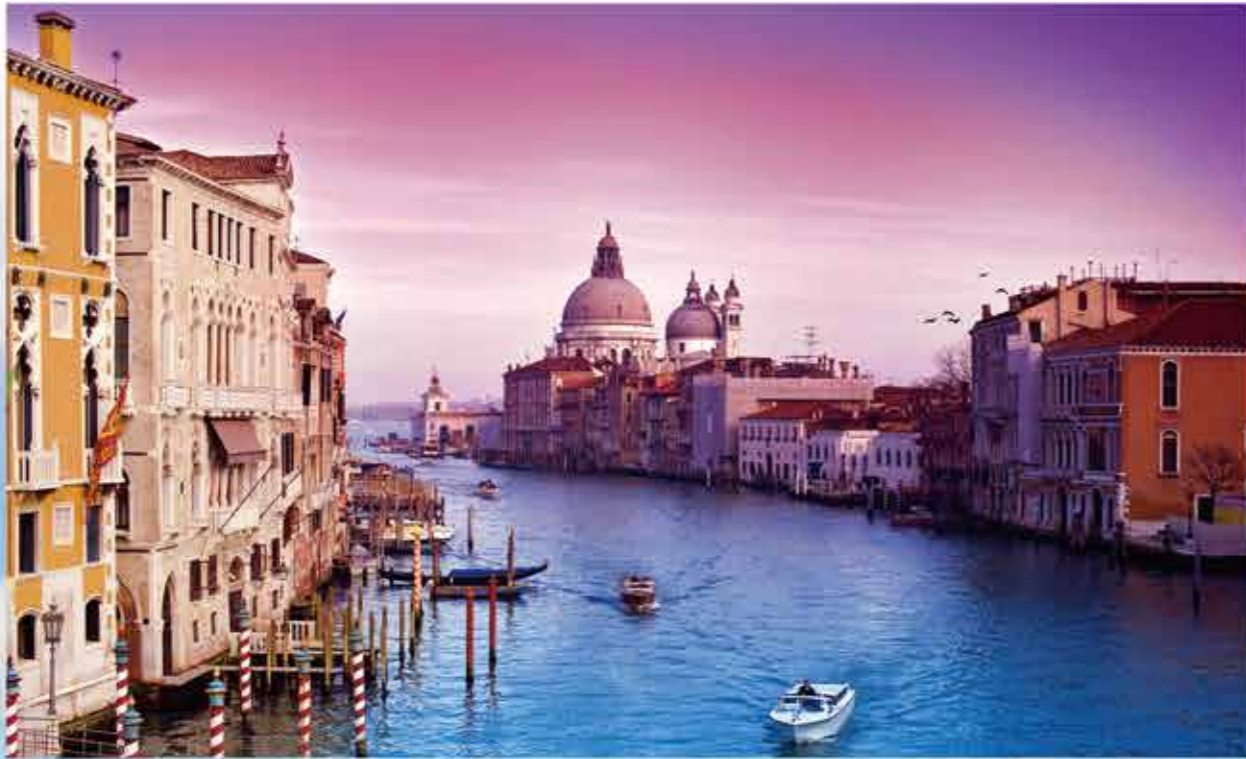
› 意大利水城威尼斯