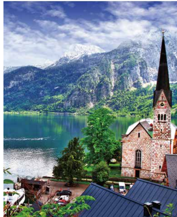
奥地利小镇湖光山色