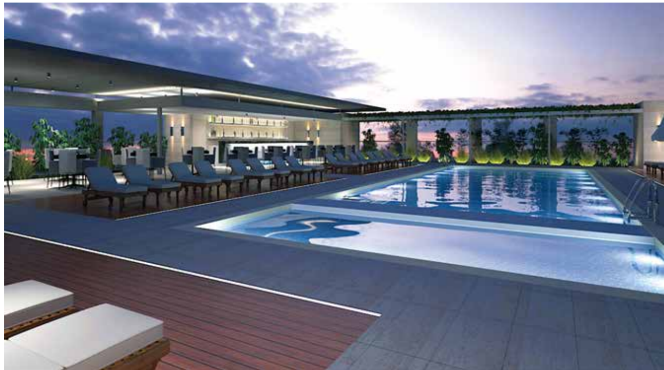
蓝天之下的空中泳池