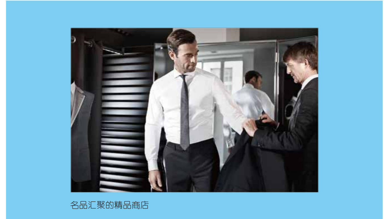
名品汇聚的精品商店