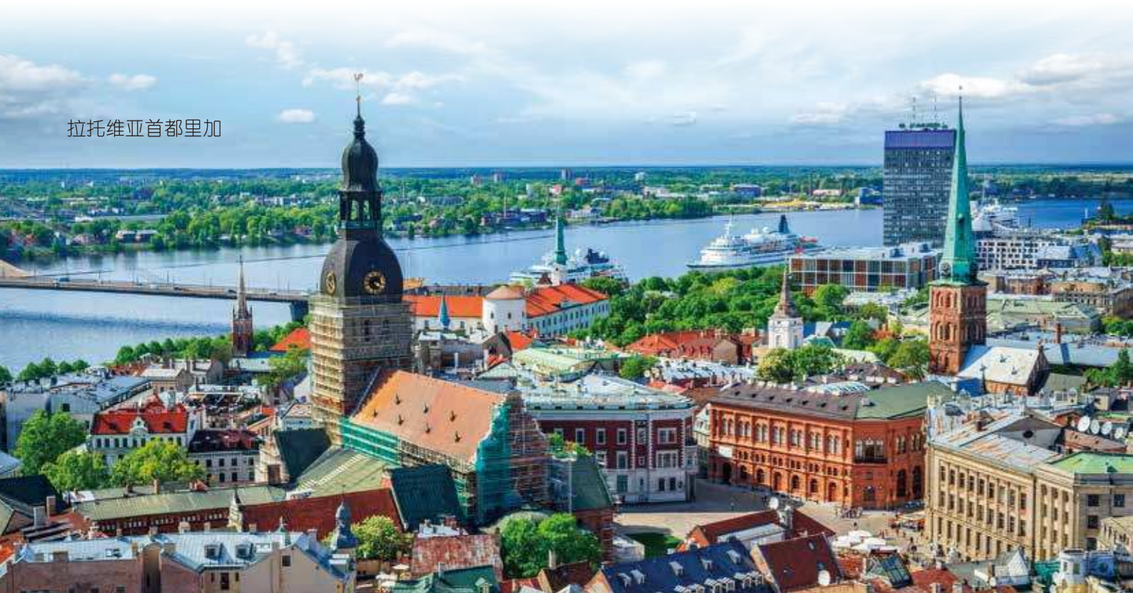
拉托维亚首都里加