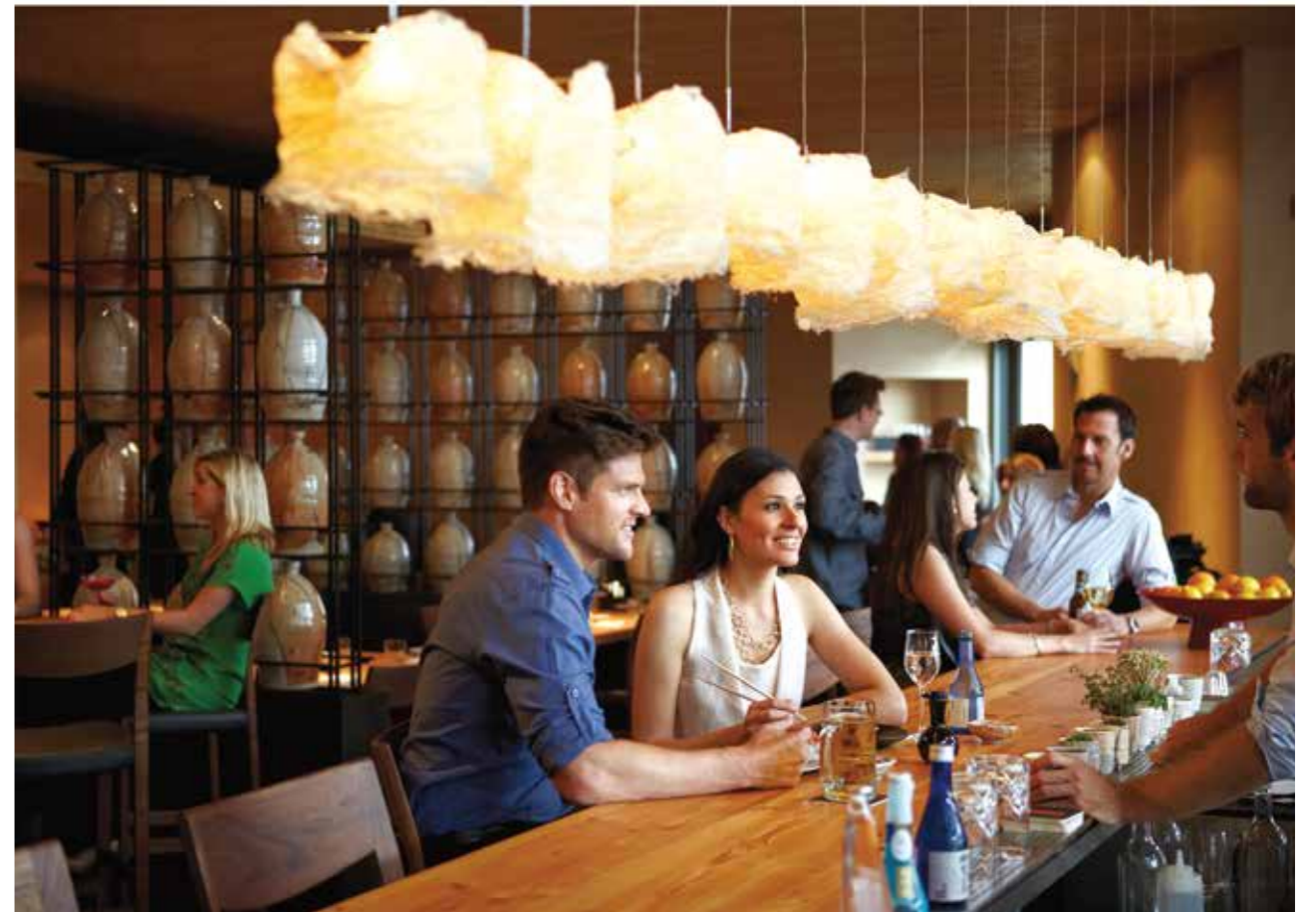
飘香四溢的咖啡餐厅，热情活力的现代酒吧