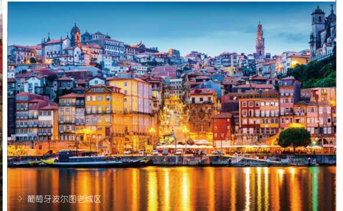
› 葡萄牙波尔图老城区