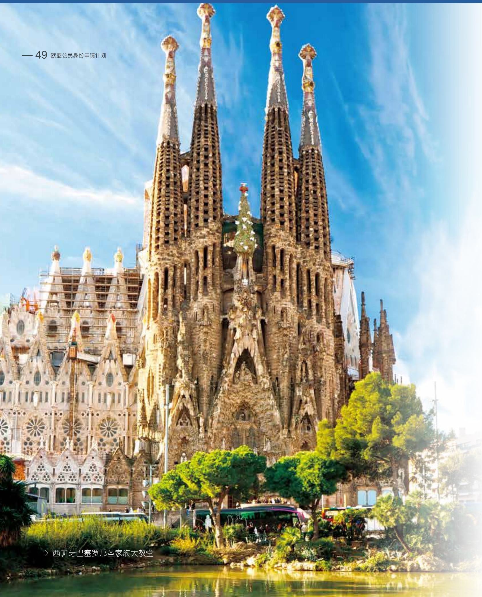
› 西班牙巴塞罗那圣家族大教堂