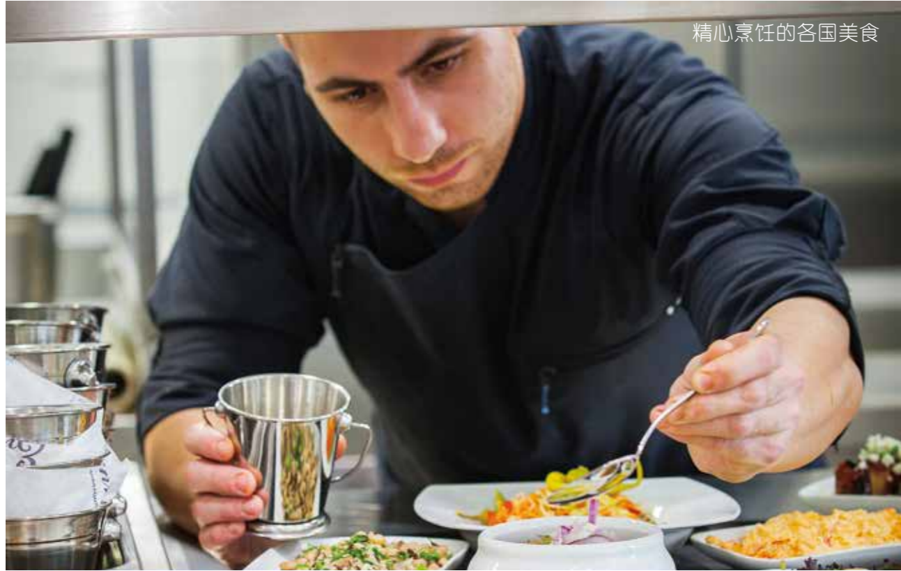
精心烹饪的各国美食