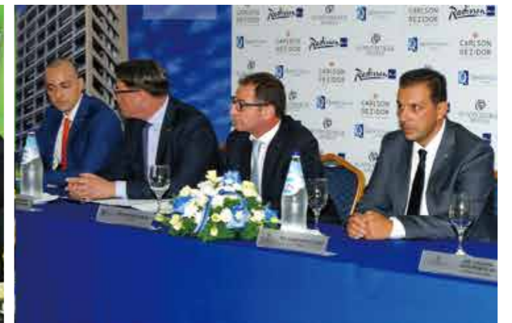
> 塞浦路斯五星级酒店新闻发布会