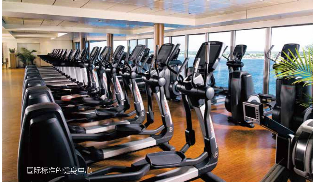
国际标准的健身中心