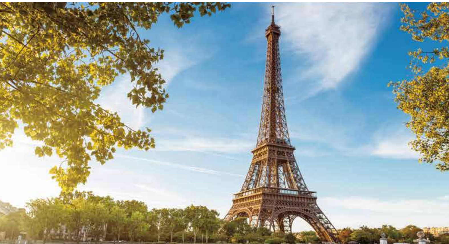
› 法国巴黎埃菲尔铁塔