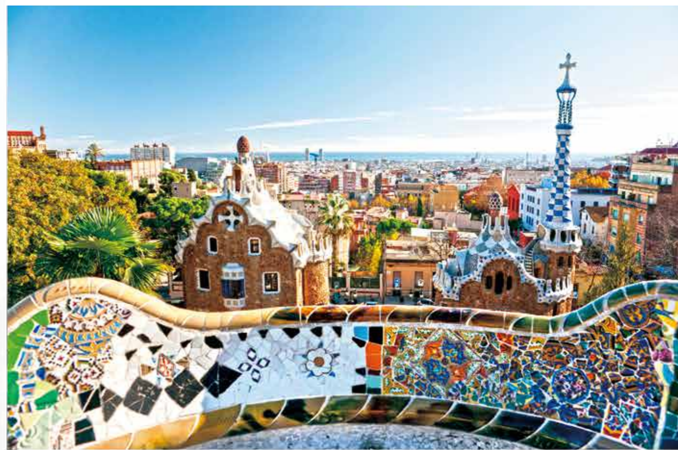
› 西班牙巴塞罗那巴特罗公园