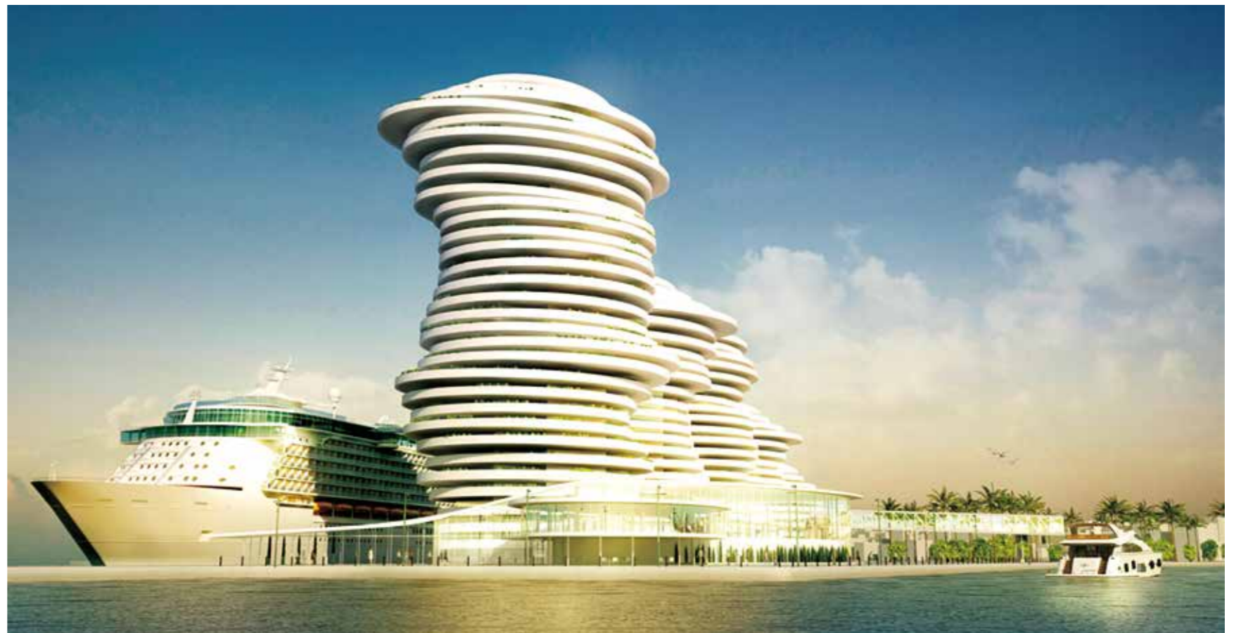
拉纳卡政府规划图