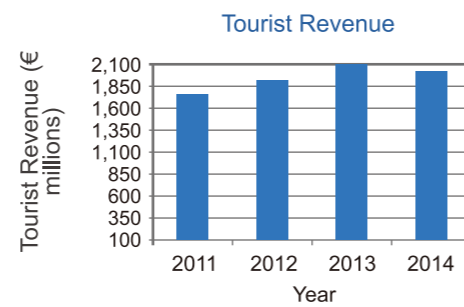
2014年，塞浦路斯旅游业收入达20亿欧元

拉纳卡作为塞浦路斯的交通枢纽和商务中心，当地的高端酒店极其匮乏，随着能源产业的发展，更多商旅客人的到来，对当地高端酒店的需求与日俱增。