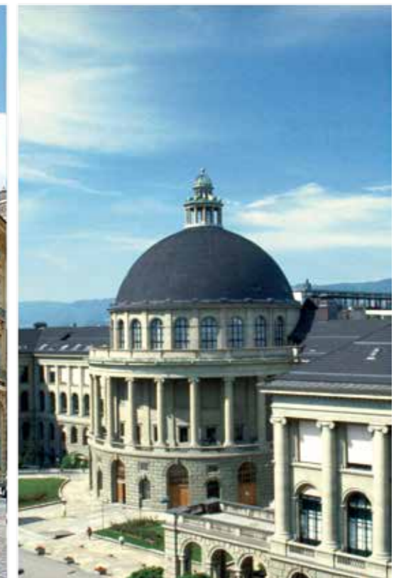
爱因斯坦的母校——瑞士苏黎世联邦理工学院