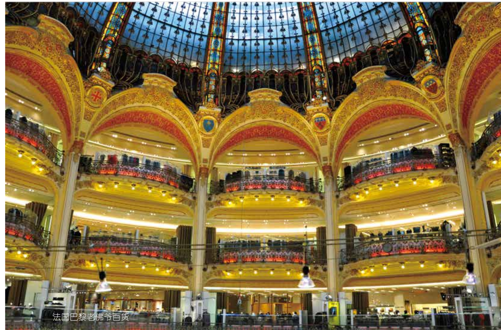
法国巴黎老佛爷百货

全世界的奢侈品大多是欧洲血统，欧洲孕育了众多拥有百年历史的奢侈品牌。这些可以追述到中世纪和文艺复兴时期的工艺，基于欧洲人民对传统工匠的尊重，得到了完整的传承，并且在现代社会发扬光大。